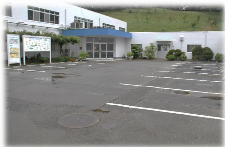
研修棟入り口 外観