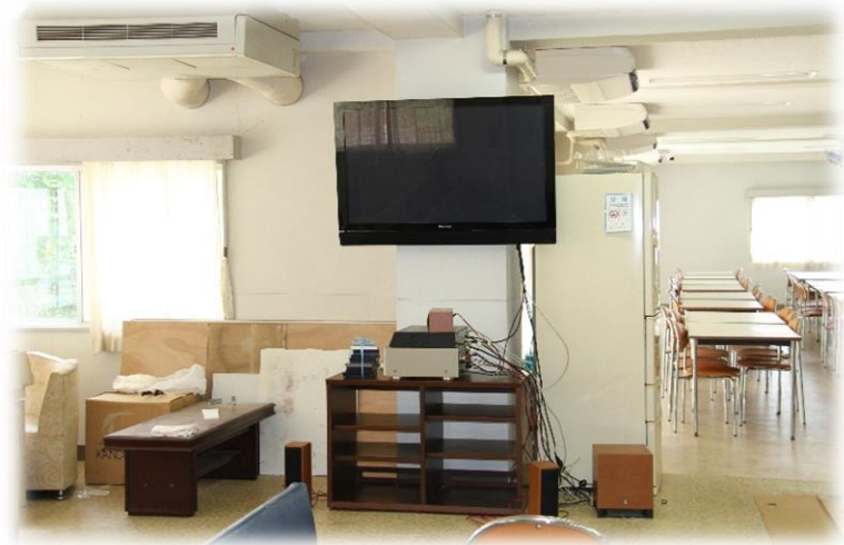
食堂横 くつろぎスペース