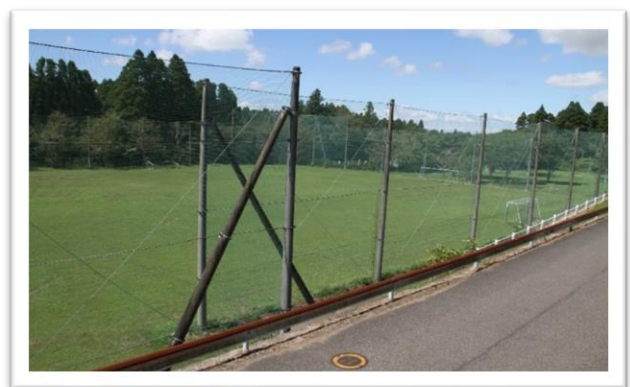
多目的グラウンド(サッカー場)