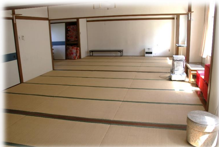
和室 (多目的) 【 20 人宿泊可 】