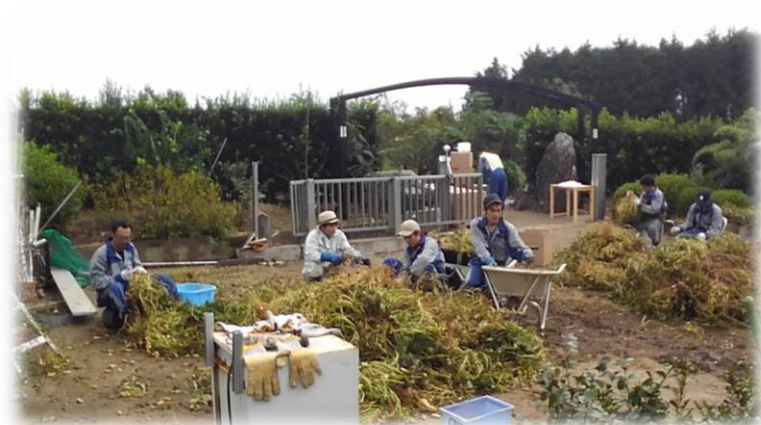
レクリエーション 体験 落花生収穫