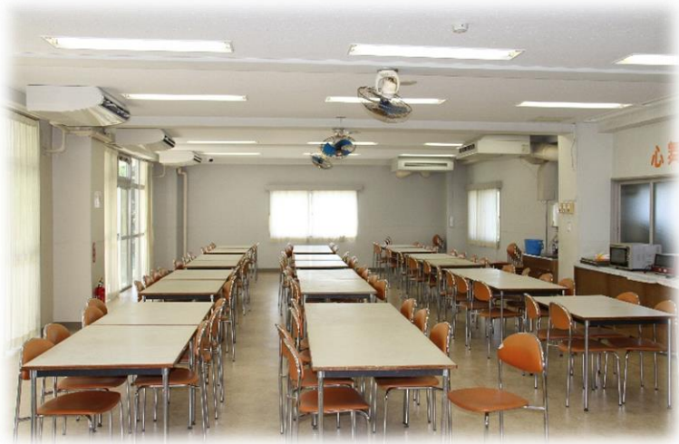
食堂 【 100 人収容 】